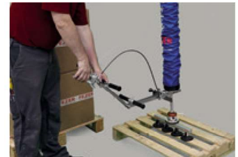
Unidade de controle MultiStacker para manipulação de materiais em qualquer altura.