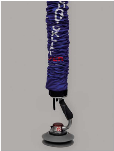
Unidade de elevação com cabeça fixa movimentação puramente horizontal ou de cargas em movimento.

A alça de comando, por exemplo, incorpora as funções de sucção, subir, descer e de liberação da carga. Como resultado, o manipulador a vácuo de alta velocidade VQL VC funciona de forma incrivelmente rápida e garante tempos de ciclo mais curtos. Ideal para movimentar bagagens, caixas, caixotes ou engradados que precisem ser recolhidos ou reembalados de forma ágil e segura. Pode ser usado com uma base de fixação direta, para movimentações horizontais, ou com rótula giratória e adaptador para entornar manualmente o material. A ferramenta de pega pode ser facilmente adaptada às necessidades do material a ser movimentado.